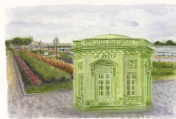
LE PAVILLOIN DES OBSERVATOIRES JACQUES HELLIE. THE WELL/JACQUES HELLIE LIBRARY QUAI LOUIS XVIII / QUAI DU MARCHÉ LÉVY, BORDEAUX

L'observatoire poursuit trois objectifs : participer aux progrès de la connaissance de l'univers (recherche), assurer la formation des étudiants (enseignement), et diffuser les connaissances dans ce domaine, notamment auprès du grand public. Fermé en 2016, il est rouvert en juin 2017 grâce à l'association Sirius (constituée en mars 2017) en partenariat avec Bordeaux Métropole, Floirac et l'Université de Bordeaux qui a pour objectifs de sauvegarder le site de l'observatoire de Bordeaux à Floirac et de construire un projet de réhabilitation du site pour la diffusion des connaissances en sciences de l'univers et l'astronomie amateur.