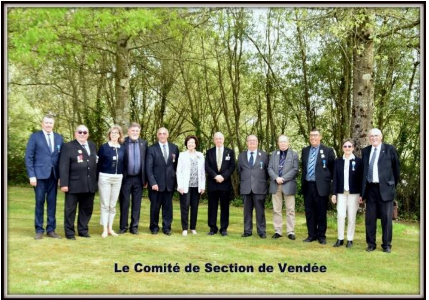
Le Comité de Section de Vendée