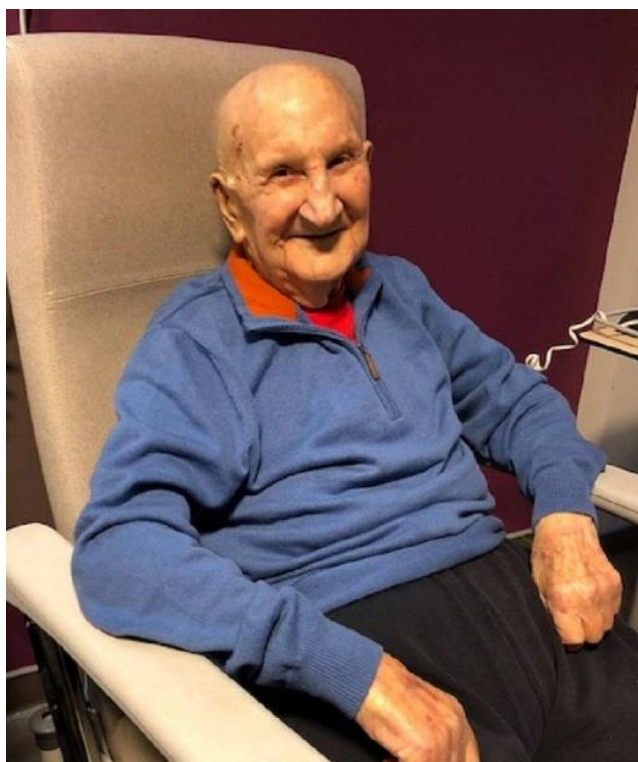
Figure incontournable de Noirmoutier, il a fait partie de l'équipe qui a lancé de grands travaux : digues, assainissement, déchetterie, ports.

Pour Barbâtre, il est difficile d'énumérer ses nombreuses réalisations. On peut relever la création du centre de secours, la construction de l'école publique et celle du foyer-logement où il résidait depuis plusieurs années.