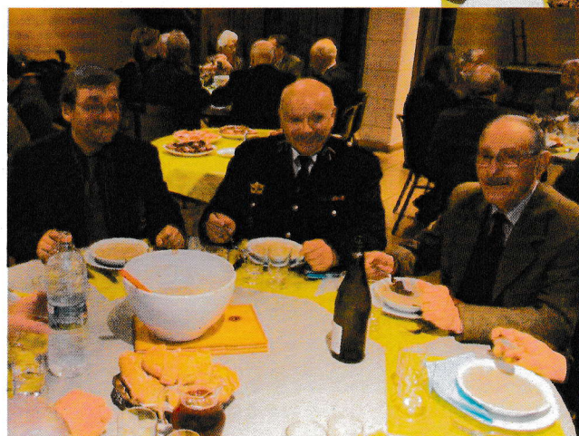
La joie régnait autour des tables